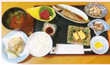
日替わりランチ 1,000円 (税込)

予約必須! 新鮮な食材を使用した日替わりランチを落ち着いた雰囲気の中でゆっくりと味わえます。亀山市南崎町 735-9 ☎0595-82-0125 🕒12:00～21:00 📅水曜日