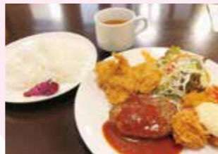
日替り定食 990円 (税込) ※写真はハンバーグ、ヒレカツ、ホタテフライ

手づくり、できたてのおいしい洋食がリーズナブルに食べられる人気店。亀山市野村 3丁目 9-2 ☎0595-82-0808 🕒11:00～14:30・17:00～21:00 📅水曜日