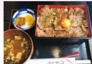
上カルビ重 (大盛) 1,300円 (税込) 食後のドリンク付 ※上カルビ重 (並) は1,000円 (税込)

築170年の自宅を改装した落ち着いた店内でおいしい松阪牛を堪能できます。亀山市野村 3丁目 17-23 ☎0595-84-4696 🕒平日/17:00～22:00 土/11:00～14:00・17:00～21:30 日/11:00～14:00・17:00～21:00 📅火曜日、第2・第4月曜日 (祝日は営業)