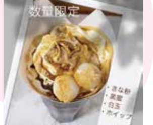
しらたま和クレープ 500円 (税込) ※数量限定

焼きたて生地のクレープとフラッペ、フロート等のドリンクをテイクアウトできるお店です。亀山市東台町 2-4 🕒(月～金) 10:30～18:00 (土日祝) 10:30～17:00 オープン時間が変更になることがたまにあります。(その際はインスタ&店頭にて前もってお知らせ) 📅不定休