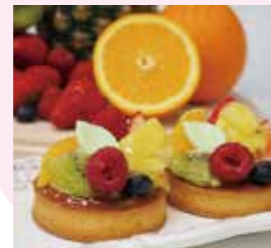
フルーツタルト 540円 (税込) フルーツの種類は季節によって異なりますのでぜひ旬のフルーツタルトをお楽しみ下さい。

シュークリーム、タルト、焼き菓子メインのかわいらしいケーキ屋さん。亀山市東丸町 517-12 ☎0595-98-4141 🕒10:30～18:30 📅日曜日・月曜日 (イベント時・祝日の場合は変更有)