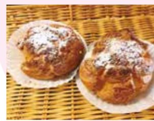
シュークリーム 259円 (税込)

オープンして20年以上。パンも売っているケーキ屋さん。毎週土日限定のかめのこうら (メガシュークリーム) も人気です。亀山市東町 1-7-16 ☎0595-98-4336 🕒9:00～19:00 (日曜 18:00) 📅月曜日 (祝日営業)