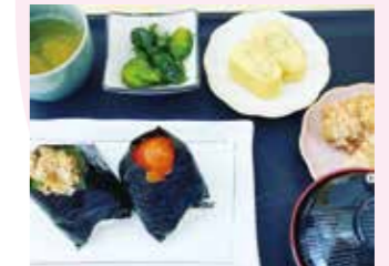
おむすびとおかずがセットになった 結セット お好みのおむすび +500円 (税込)

ご注文を受けてから握る出来立てのおむすびをイートイン、テイクアウトで楽しめるお店です。亀山市東町 1-6-11 ☎090-9124-9465 🕒11:00～15:30 (オーダーストップ 14:30) 📅土曜日・日曜日・祝日