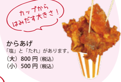
からあげ 「塩」と「たれ」があります。(大) 800円 (税込) (小) 500円 (税込)

からあげやベビーカステラなど、お祭りのようなメニューがいっぱい。亀山市東町 1-3 ☎090-9184-8855 🕒10:30～18:30 📅木曜日