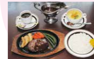
松阪牛 (三重県産) 100% スペシャルハンバーグ 1,800円 (税込)

三重県産特選松阪牛にこだわった元祖肉の水炊き・石焼・焼き焼・ステーキの老舗店。亀山市東町 1-5-12 ☎0595-82-3344 🕒11:00～14:00・17:00～22:00 (オーダーストップ 20:30) 📅第1・第3日曜日