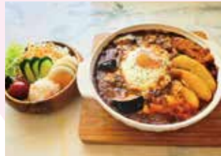
とろーチーズの焼きカレー 季節の野菜を添えて… (ミニサラダ付) 930円 (税込) ※大盛り+100円

開店から今年で46周年。豊富なメニューを取り揃えています。亀山市布気町 1451-2 ☎0595-82-5940 🕒10:00～16:00 (ラストオーダー 15:00) 📅火曜日