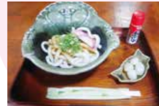
名物 伊勢うどん 500円 (税込)

明治後期に建てられた町屋を改装した連子格子のお店。登録有形文化財に指定されています。亀山市野村町 3-2-11 ☎0595-82-3986 🕒11:00～15:00 📅月曜日・金曜日