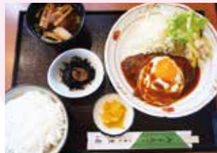
日替わりランチ 850円 (税込) ハンバーグ デミソース目玉焼 ご飯、赤だし、サラダ、小鉢、漬物付き ・食後のHOT: コーヒー or 紅茶 150円 ・食後のICE: コーヒー or 紅茶 200円

地元旬の食材を生かしたメニューはお寿司、麺類、洋食などバラエティ豊か。亀山市東丸町 521-6 ☎0595-82-0233 🕒11:00～13:50・17:00～18:00 📅日曜日・祝日 土曜日の14:00以降